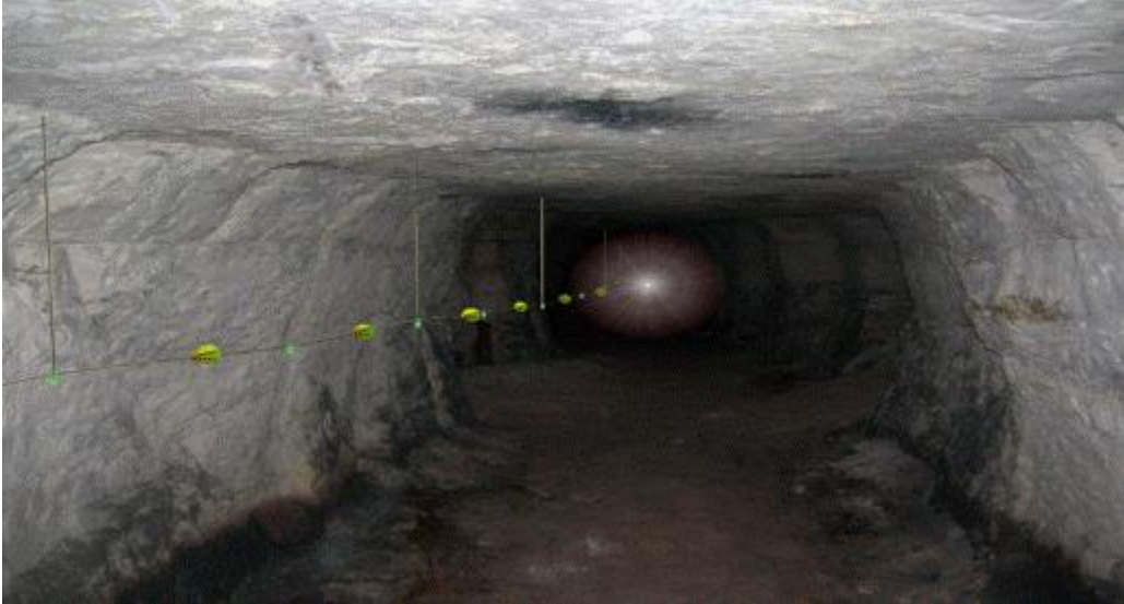
Şekil-1: Hayat hattı görünümü

18. (Ek:RG-10/3/2015-29291) (3) Yeraltı madenlerinde, hazırlık faaliyetlerinin yapıldığı alanlar ve üretim panoları gibi yeraltı maden işletmesinin bütün bölümlerini kapsayacak şekilde ve çalışanların yerüstüne çıkmalarını kolaylaştıran; yanmaya, kopmaya ve aşınmaya karşı dayanıklı bir hayat hattı kurulur (Şekil-1 ve Şekil-2). Bu hatlar acil durum planlarına uygun olarak yerleştirilir.